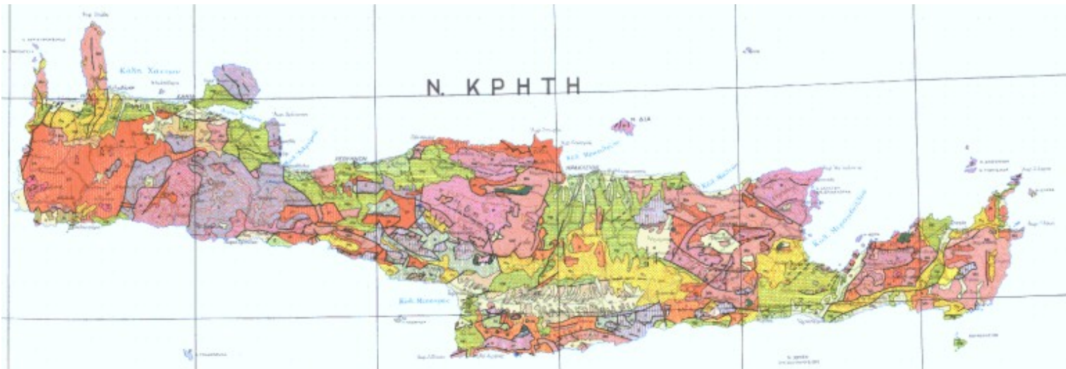
Εικόνα 1. Τμήμα του γεωλογικού χάρτη της Ελλάδας σε κλίμακα 1:500.000. Με κίτρινες και πράσινες αποχρώσεις οι λεκάνες του Νεογενούς και του Τεταρτογενούς. Με σκούρο ροζ χρωματισμό αποτυπώνεται η ομάδα Πλακωδών Ασβεστολίθων και με πορτοκαλί χρωματισμό η Ομάδα Φυλλιτών – Χαλαζιτών.