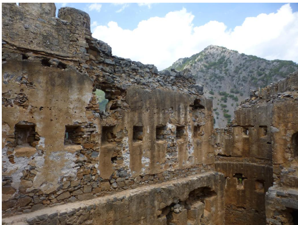
Εικόνα 4. Εσωτερική παρειά του βόρειου τοίχου στον κουλέ της Αγίας Ρουμέλης με τις δύο σειρές τυφεκιοθυρίδες σε στεγασμένους χώρους και τρίτη σειρά στο δώμα.

Σημαντικό χαρακτηριστικό της κατασκευής αποτελεί η διαμόρφωση των οπών σκόπευσης, αναλογικά με το πάχος της λιθοδομής, διαμορφώνοντας κεντρική οπή πλάτους 8 έως δέκα εκατοστών και ύψους 25 έως τριάντα, ενώ η μεταξύ τους απόσταση άλλοτε κυμαίνεται μεταξύ 1,70 και 2,00 μέτρων, όπως στο Φραγκοκάστελλο και στον κουλέ του Μέρωνα και άλλοτε μεταξύ 0,80 και 1,00 μέτρου, όπως στην Βασιλική Ιεράπετρας, στην Αγία Ρουμέλη και στο Νιό Χωριό.