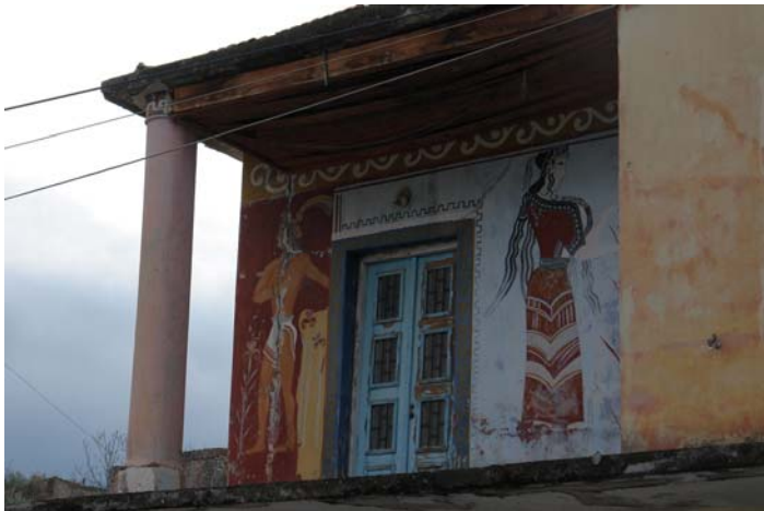
Τοιχογραφία σε εξώστη στον οικισμό Μουρτζανά Μυλοποτάμου, (δεκαετία 1950).

Στις απαρχές των μοντέρνων καιρών, πρώτος ο Ιταλός αρχαιολόγος Federico Halbherr ανακαλύπτει την επιγραφή με τους νόμους στην Γόρτυνα και ο πολυσχιδής βρετανός sir Arthur Evans την Κνωσό. Μέσα σε λίγα χρόνια, ο λόφος της Κεφάλας αναδεικνύεται σε ατέρμονη πηγή αρχιτεκτονικών μορφών, διακοσμητικών μοτίβων και χρωμάτων. Επανασχεδιασμένα ανάλογα με τις τεχνικές ιδιοτροπίες υλικών και επεξεργασιών, αυτά τα νέα στοιχεία έρχονται να σταθούν κοντά στα δεδομένα ως παραδοσιακά, συνεργαζόμενα στην προώθηση ενός ενιαίου λεξιλογίου για την δόμηση της απαραίτητης εκείνης παράδοσης που θα μπορούσε να κάνει την διαφορά, σε σχέση με τις άλλες ελληνικές περιφέρειες.