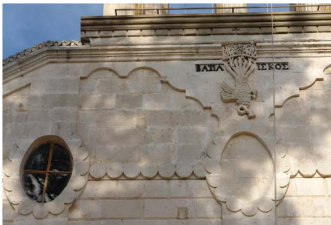
Λιθόγλυπτος διάκοσμος με μινωικά, βυζαντινά και μπαρόκ στοιχεία, στην εκκλησία του οικισμού Κεφαλάς Αποκορώνου. (έτος κατασκευής 1912).

Αν η Βενετοκρατία είναι η εποχή των μεγάλων οικοδομικών έργων, στα χρόνια της Τουρκοκρατίας, περίοδο κάποιας οικονομικής σταθερότητας στις υποδεέστερες κοινωνικές ομάδες, ειδικά στην ύπαιθρο, οφείλεται μάλλον περισσότερο από ότι σε άλλες τέχνες, η εξέλιξη της υφαντικής. Το μοτίβο της 'εκκλησίας' που κυριαρχεί στα υφαντά και στα κεντήματα και το οποίο στην πορεία, μετά το 1960, μέσα από τις γραφιστικές επεξεργασίες των εταιρειών 'Πεταλούδα' και 'DMC', εδραιώθηκε ως κρητικό κέντημα, δεν είναι άλλο από τη σμίκρυνση του κεντρικού σχεδίου στο χαλί προσευχής των μωαμεθανών και ακριβέστερα, όπως αυτό εμφανίζεται στις υφάνσεις την περιοχής Σίβας στην Ανατολία.