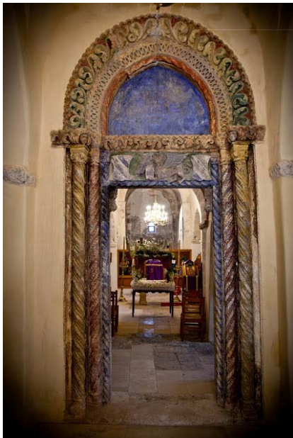
Το γοθικό θύρωμα στην εκκλησία του Άη Γιώργη στον οικισμό Καμαριώτης Μαλεβιζίου.

Αφήσαμε πίσω στην μέχρι τώρα περιήγηση τόσο τον μινωικό, όσο και τον ελληνορωμαϊκό πολιτισμό, παρόλο που κι εκείνοι οφείλουν τα μέγιστα στο 'κρητικό' συστατικό τους. Όμως αυτό που υπήρξε 'κρητικό' στον αρχαίο κόσμο, ελάχιστη σχέση μπορεί να έχει με το σύνολο των χαρακτήρων που σήμερα θεωρούμε ως τέτοιους, από την κεραμική έως την δίαιτα. Η αρχαιότητα, ή καλύτερα η προϊστορία, άρχισαν να έχουν ενεργό ρόλο ως γλωσσάρι και διαθέσιμο πολιτιστικό δυναμικό, μόνο τα τελευταία εκατόν χρόνια, όταν άρχισαν να έρχονται στο φώς τα θαμμένα 'ανάκτορα' των Μινωιτών και οι πόλεις των Δωριέων, και δεν πρέπει να μας μένει αδιάφορη η σύμπτωση ότι αυτό συμβαίνει στην αυγή των μοντέρνων καιρών.